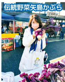
伝統野菜矢島かぶら