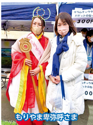
もりやま卑弥呼さま