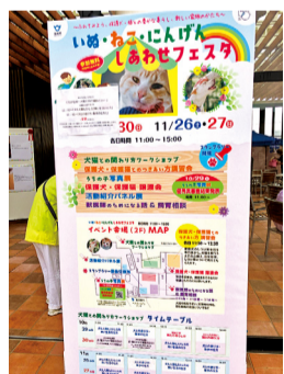
令和4年度初開催の譲渡会もある動物愛護イベントも引き続き開催予定です!