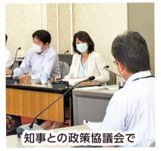
知事との政策協議会で