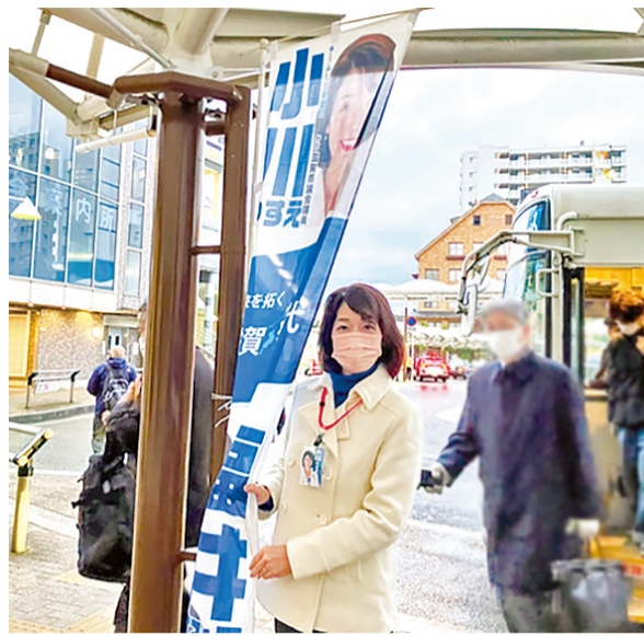
コツコツ続けてきた、朝の駅での県政レポートの配布。お声かけくださる方も少しずつ増えてきました。本当にありがとうございます！

たくさんの方に応援いただき、県政の場で仕事をさせていただき、はや4年となりました。そのほとんどがコロナ禍の中での活動となりましたが、現職として活動できること、様々な声を伝えられるありがたさを噛み締めながら、できることに精一杯取り組んできた日々でした。目に見える成果も一定得ることができましたが、まだまだやるべきことも山積しています。引き続き、頑張って参りますので、どうぞよろしくお願いいたします。