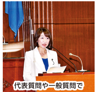
代表質問や一般質問で