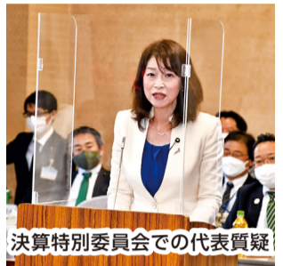
決算特別委員会での代表質問