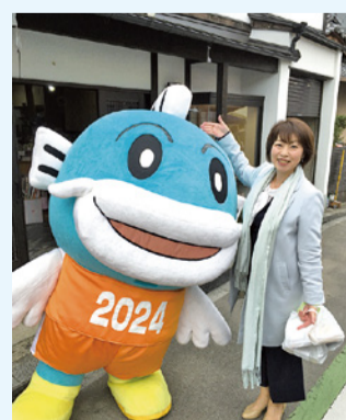
もりやま市でキャッフィー発見！