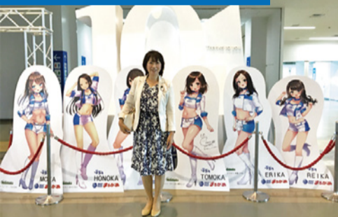
ナイター営業で好調の丸亀ポート

総務・企画常任委員会の視察。岡山県庁では災害時の行方不明者名公開について、丸亀市ではポート場運営について、高知市では木質バイオマス発電の工場調査、徳島県庁では RPA（ロボットによる業務自動化）について学ばせていただきました。お世話になった皆様、ありがとうございました！