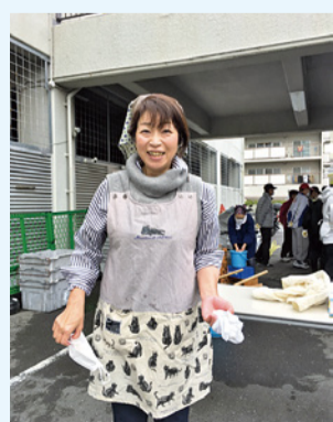
地元のお餅つきのお手伝い。

出初式では県議を代表して挨拶し、「女性の視点を取り入れた防災力強化」取り組みを紹介。