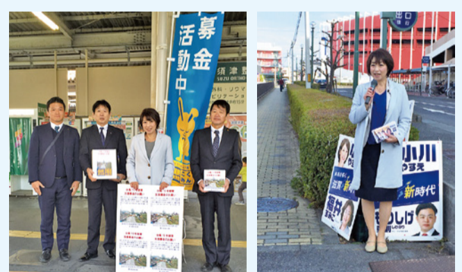
台風19号被災者支援募金など、仲間と街頭活動。

灯りでつなぐ、守山2019。ギネス世界記録達成！ 51626枚の「思い」が中洲ふれあいの灯できらめきました！