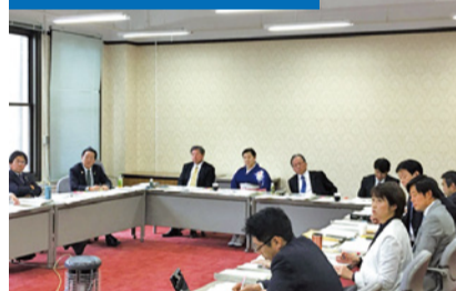
4日間に渡る予算聴取。

2月17日から始まる2月定例会議は次年度予算を決める大切な議会。会派から知事への予算要望活動や、各部からのヒアリングを行いました。自分が取り組んだことが予算に反映されているかどうか、しっかりとチェックしてまいります！！